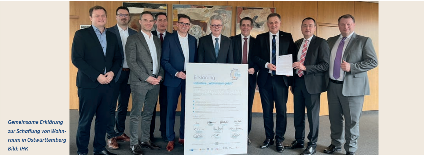
Gemeinsame Erklärung zur Schaffung von Wohnraum in Ostwürttemberg

Die Region Ostwürttemberg befindet sich inmitten eines tiefgreifenden wirtschaftlichen Strukturwandels, der durch technologische Entwicklungen, geopolitische Unsicherheiten und den Übergang zu einer klimaneutralen Wirtschaft ausgelöst wird. Dieser Wandel zeigt sich bereits konkret: Unternehmen ziehen sich zurück oder strukturieren um. In regionalen Gewerbeschwerpunkten sind deutliche Veränderungen sichtbar. Es ist jetzt schon absehbar, dass dieser Prozess Transformationsflächen von 50-100 ha an Gewerbefläche in der Region verfügbar macht. In dieser Situation wird die strategische Steuerung und Nutzung von Gewerbeflächen zur zentralen Aufgabe.