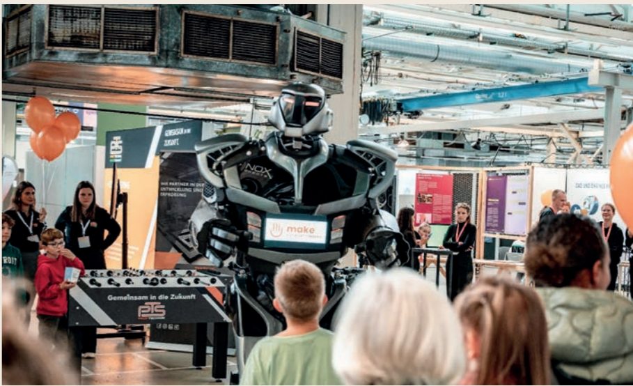
Make Ostwürttemberg