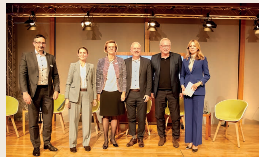
Ostwürttemberg meets Berlin