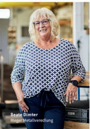
Beate Dimter Rieger Metallveredlung