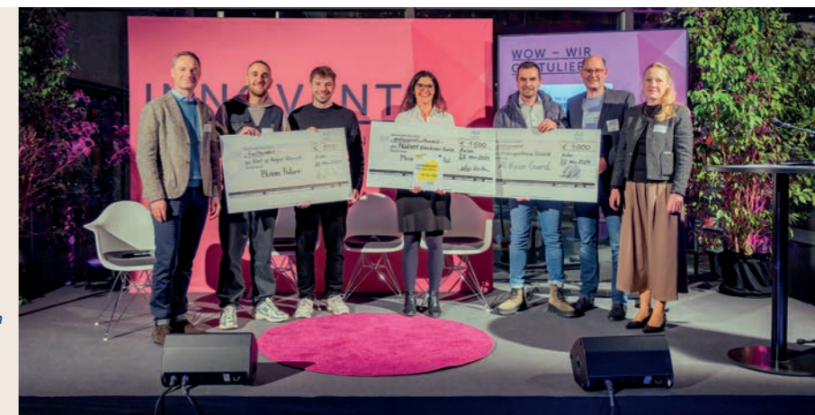
Bühne für Innovationen Die Startup WOW Challenge

Wir bringen daher Unternehmen, Lösungspartner und Wissenschaft in Netzwerken, Kongressen oder auf Exkursionen zusammen, organisieren branchenübergreifende Technologienetzwerke und begleiten die Umsetzung der Innovationsprojekte.