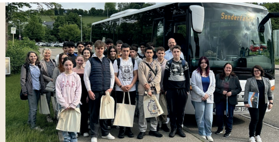
Matching von Fachkräften und Betrieben - der Jobbus der Region

Wertvolle Impulse kommen aus landesweiten und regionalen Studien des Transformationsnetzwerks Ostwürttemberg wie zum Beispiel die regionale Future Skills Studie. Die Umsetzung erfolgt auf Basis eines Aktionsplans entlang der gemeinsam definierten Handlungsfelder.