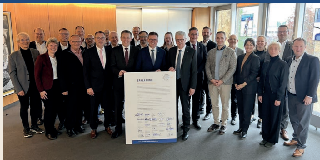
Steuerungskreis