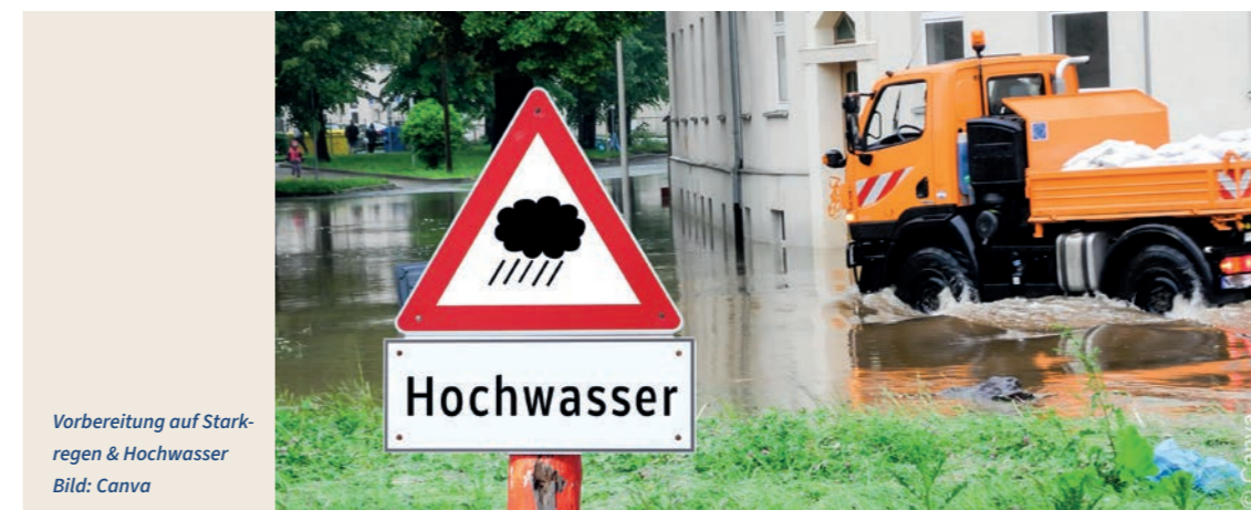
Vorbereitung auf Starkregen & Hochwasser

Ein resilienter Bevölkerungsschutz (Resilienzmanagement) sowie die systematische Anpassung an die Folgen des Klimawandels sind daher wichtig, um Bevölkerung, Umwelt und Infrastruktur zu schützen und die Auswirkungen von Krisen und Katastrophen zu minimieren. Ziele sind die Verbesserung der Krisenvorsorge und -planung, die Stärkung des Bevölkerungsschutzes sowie der Selbsthilfefähigkeit der Bürgerinnen und Bürger.