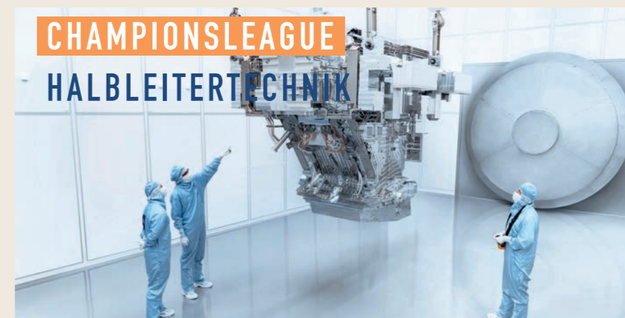
Spitzenposition bei Halbleitertechnik