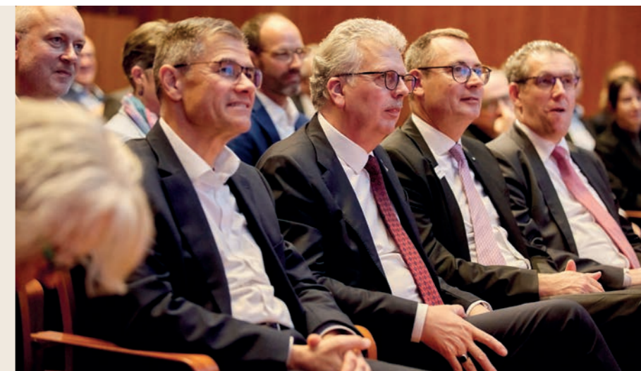
Ostwürttemberg meets Berlin

Ostwürttemberg ist erfolgreich im Wandel und wir bleiben dran. Wie das nächste Kapitel zeigt, haben wir Handlungsfelder und Projekte neu fokussiert sowie neue Projektideen entwickelt und treiben die erfolgreichen Initiativen weiter voran.