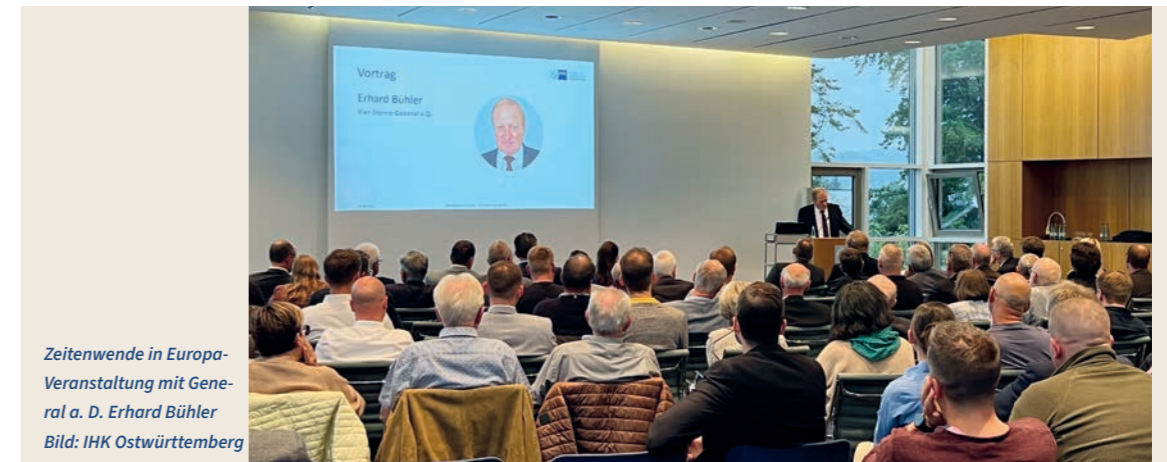
Zeitenwende in Europa- Veranstaltung mit General a. D. Erhard Bühler

Deutschland ist erstmals seit Ende des Kalten Krieges wieder sicherheitspolitisch bedroht, ergänzt um hybride Konflikte und neue Technologien. Gemäß der Nationalen Sicherheitsstrategie sollen bis zum Jahr 2029 die Fähigkeit zur wirksamen militärischen Gesamtverteidigung aufgebaut und mögliche Gegner von einem Angriff auf NATO, EU oder Deutschland abgeschreckt werden.