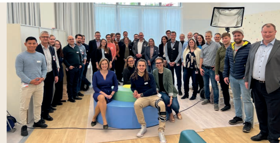
IHK-Netzwerktreffen Nachhaltigkeit bei der Arnulf Betzold GmbH

Eine zukunftsfähige Region denkt Wirtschaft und Ressourcen zusammen. Die Kreislaufwirtschaft ist ein zentraler Hebel für ökologische Nachhaltigkeit, regionale Wertschöpfung und wirtschaftliche Resilienz. Anstelle eines linearen Verbrauchsmodells setzt sie auf die Wiederverwendung, Reparatur, Aufbereitung und das Recycling von Produkten und Materialien. So werden Abfälle zu Ressourcen und regionale Stoffströme effizienter und unabhängiger gestaltet. In Ostwürttemberg bestehen bereits vielfältige Ansätze zur Förderung der Kreislaufwirtschaft – vom Cradle-to-Cradle-Netzwerk über regionale Recyclingstrategien und der Effizienzsteigerung durch