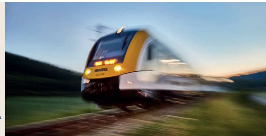
Ausbau der Schienen- infrastruktur der Region.

Ausbau des ÖPNV, intelligente Verkehrskonzepte und eine bessere Verknüpfung aller Verkehrsträger. Elektro- und Wasserstoffmobilität und der Ausbau der digitalen Infrastruktur leisten dabei einen zentralen Beitrag zur umweltfreundlicheren Regionalentwicklung.