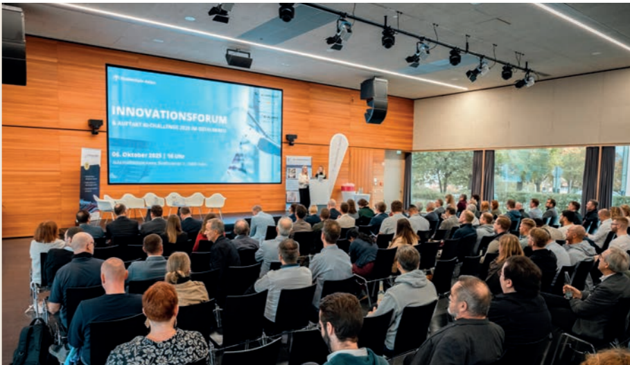
Innovationsforum 2025 der KI-Werkstatt Mittelstand und Auftakt zur KI-Challenge