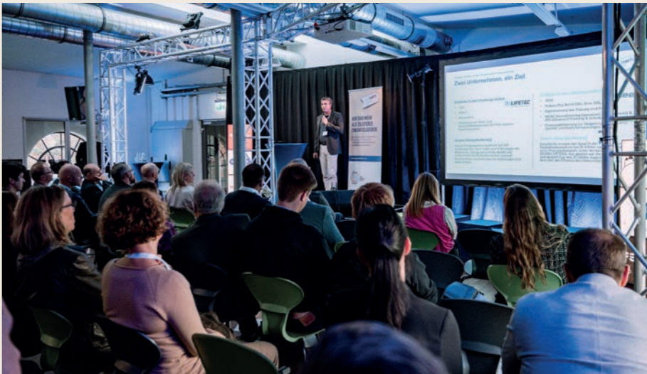
Transformationschallenger: Result Day 2025 im DOCK 33