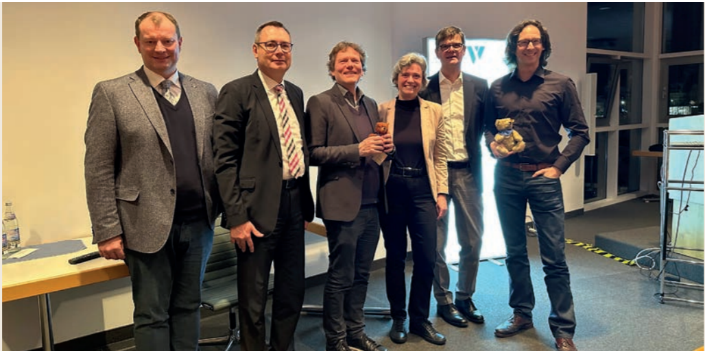
Veranstaltungsreihe „Let’s talk“: Blick über den Tellerrand mit Prof. Dr. Hartmut Rosa

In der Verteidigungswirtschaft sehen wir, aufgrund von Kompetenzen in Unternehmen, bei Hochschulen und Forschungseinrichtungen, Potenzial und wollen dieses Kompetenzfeld ausbauen. Hierfür wollen wir ein Innovationsökosystem aufbauen und weiterentwickeln. Dabei geht es darum etablierte Unternehmen zu unterstützen, neue Zulieferer aufzubauen und Produktinnovationen in Zusammenarbeit mit der Forschung und Kooperationen mit Start-ups voranzutreiben.