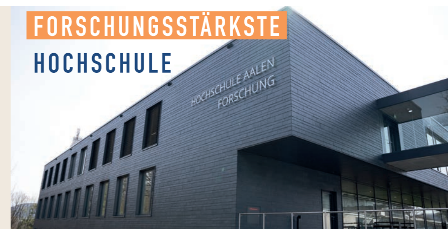
Bundesweit vorn: Hochschule Aalen