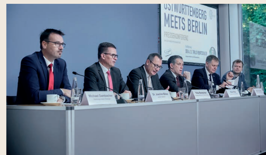
Ostwürttemberg meets Berlin