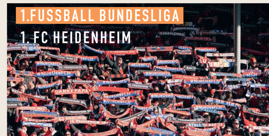
Sportlich erfolgreich - 1. FC Heidenheim