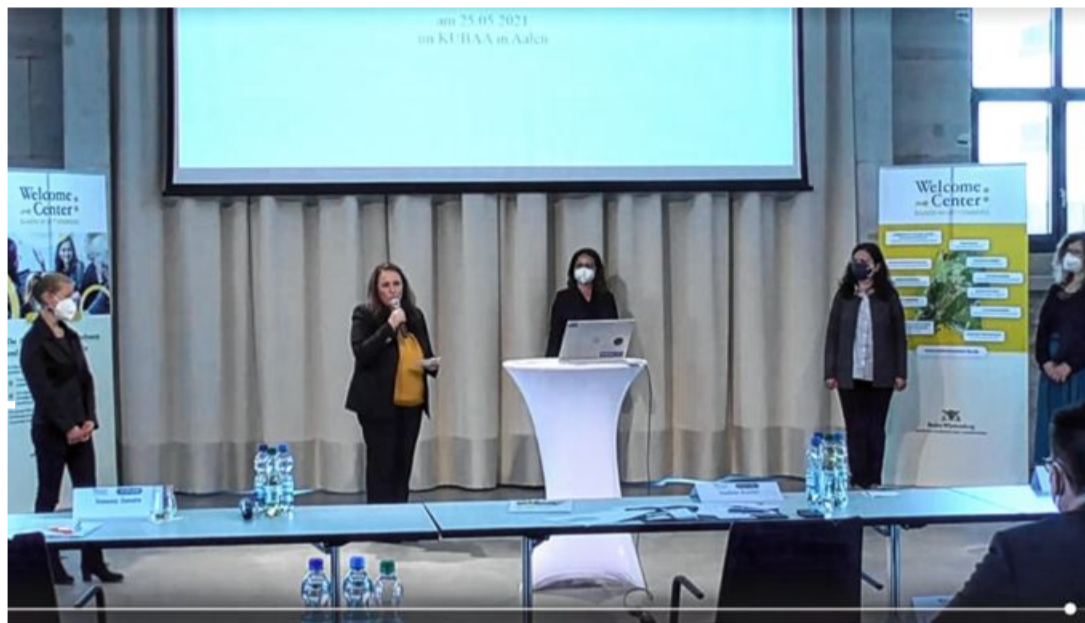
Mit einer digitalen Veranstaltung wurde das Welcome Center Ostwürttemberg eröffnet.