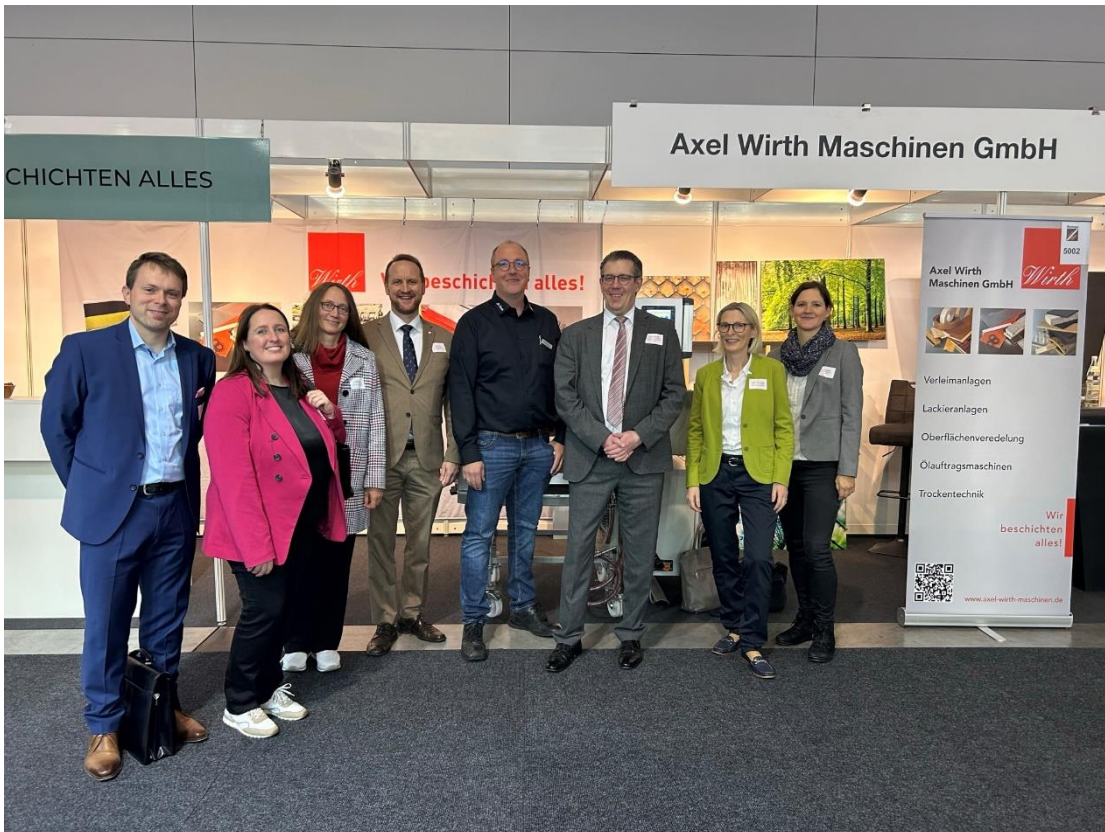
Bildunterschrift: Die Ostwürttemberg-Delegation zu Besuch am Blechexpo-Messestand der Axel Wirth Maschinen GmbH aus Oberkochen