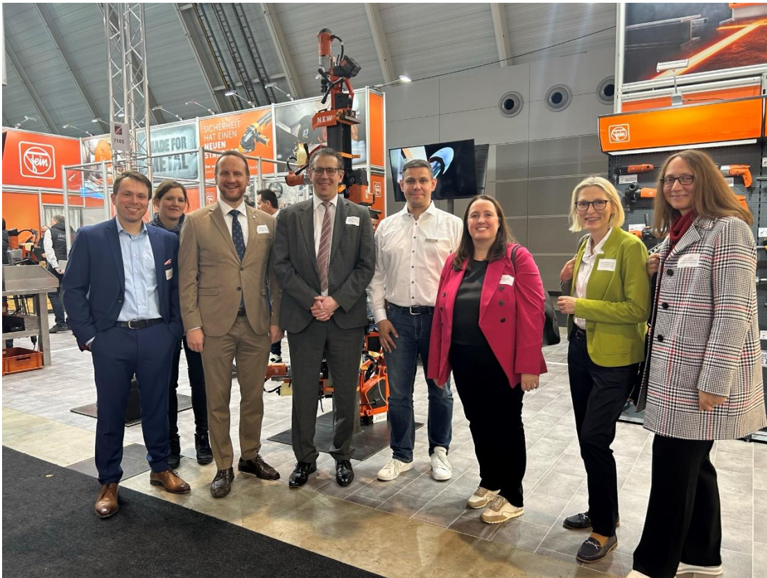
Bildunterschrift: Die Ostwürttemberg-Delegation zu Besuch am Blechexpo-Messestand der C. & E. Fein GmbH aus Schwäbisch Gmünd