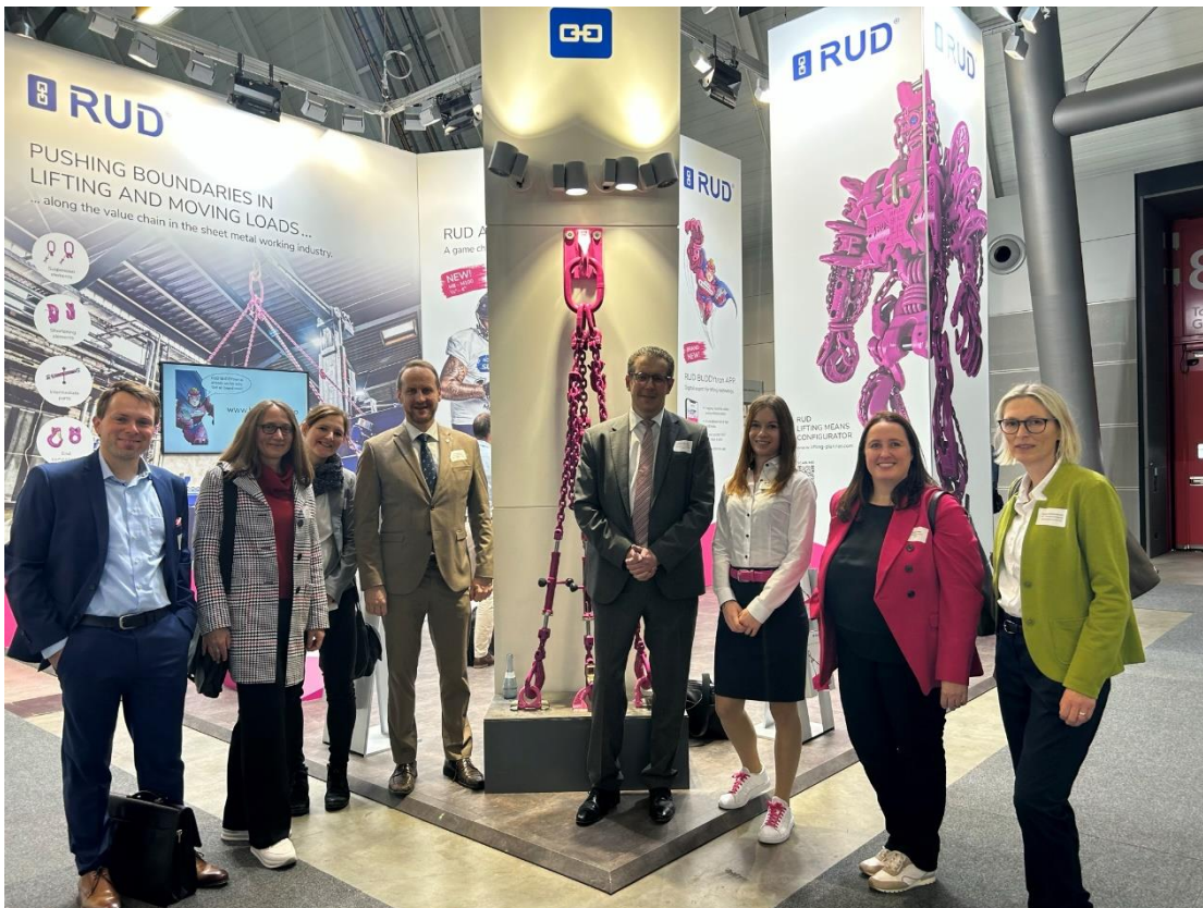
Bildunterschrift: Die Ostwürttemberg-Delegation zu Besuch am Blechexpo-Messestand von RUD Ketten aus Aalen