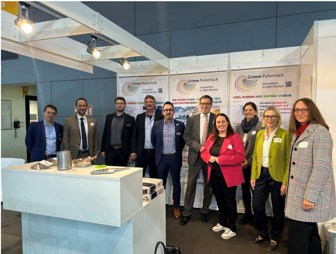
Bildunterschrift: Die Ostwürttemberg-Delegation zu Besuch am Blechexpo-Messestand der Grimm Pulverlack GmbH aus Bärenhof/Schwäbisch Gmünd