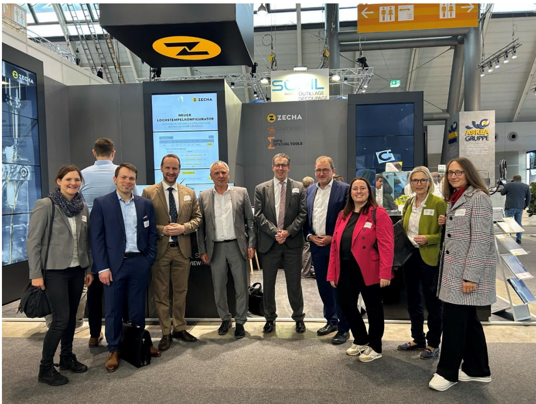
Bildunterschrift: Die Ostwürttemberg-Delegation zu Besuch am Blechexpo-Messestand der MPK Special Tools GmbH aus Schwäbisch Gmünd